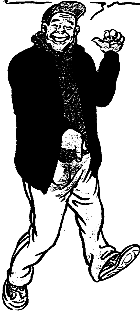
Illustration de Martin VEYRON, pour le dossier « Mais si, ils aiment lire ! », Le Nouvel Observateur , 4 au 10 mars 1999.

"LECTURE"? C'EST LÀ QU'IL FAUT APPUYER SUR LE MAGNETOSCOPE!